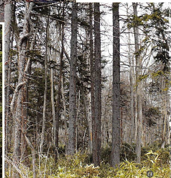
⑦沙流川源流の森林(日高町、1984年10月、梅沢 俊撮影)⑧冬の針葉樹林(阿寒国立公園 ペンケトー、1999年10月、梅沢 俊撮影)⑨針葉樹林とダケカンバ(鹿追町 東ヌブカウシ山、1996年6月、福地郁子撮影)⑩ブナ林(黒松内岳、1996年6月、梅沢 俊撮影)⑪エゾマツとトドマツ(釧北峠、1981年9月、鮫島惇一郎撮影)⑫カツラの萌芽(札幌市 円山公園、2010年5月、在田一則撮影)⑬針葉樹林と林床(雄阿寒岳、2000年7月、梅沢 俊撮影)⑭アカエゾマツ天然林(江別市 野幌森林公園、2009年4月、春木雅寛撮影)