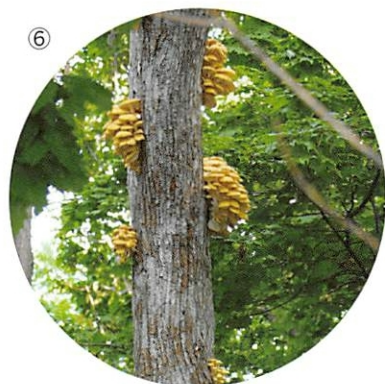
①春の針広混交林(夕張市、1995年5月、梅沢 俊撮影)②初夏の溪畔林(函館市 松倉川、2007年6月、長坂 有撮影) ③秋の夏緑林(札幌市 定山溪、1995年10月、梅沢 俊撮影)④冬のカシワ林(早来町、1989年2月、梅沢 俊撮影)⑤ベニテングタケ(美国町 古平川、2004年9月、落合克尚撮影)⑥タモギタケ(札幌市 藻岩山、2007年8月、福地郁子撮影)