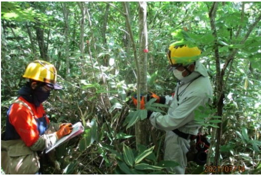
藪を漕いで行われた生長調査の様子