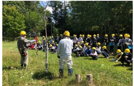
松井協会員が手鎌による草刈りの実演指導