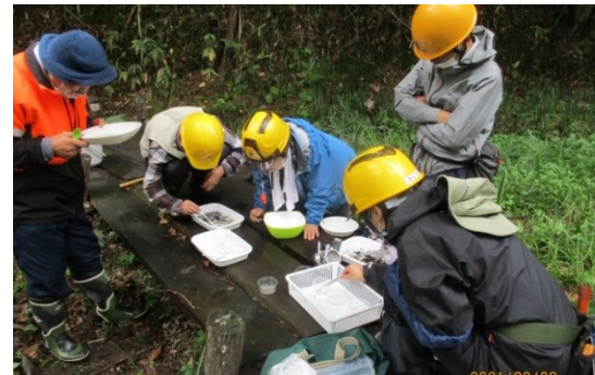
水生生物同定の様子(上流橋)