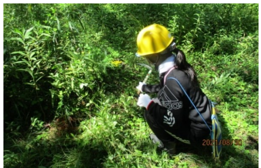
草刈りは初めてという子がほとんど