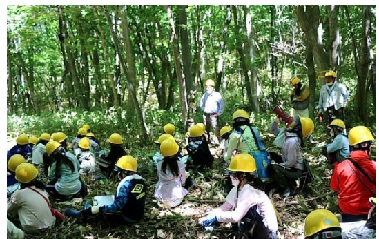
木漏れ日の下で樹の話を聴く