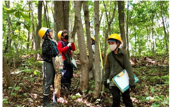
マイツリーを観察

又、紅桜公園は月曜日休館の為に本来ゲートは閉まっていますが、お願いして開錠して頂き通常ルートから入ることが出来非常に助かりました。特にこの日は最高気温34℃の予報が出ていて、活動開始時の10時では30℃を超えていて熱中症が心配されましたが、森の中は2~3℃低く感じられ、木陰での活動で体調を崩す生徒もいなくてホットしました。(文・平、大窪)