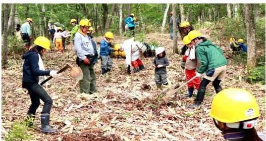
親子共同作業で35本の植樹をする