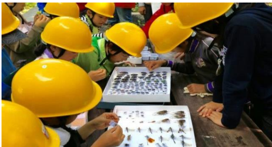
澄川の森にいる昆虫の標本を手にとって観察