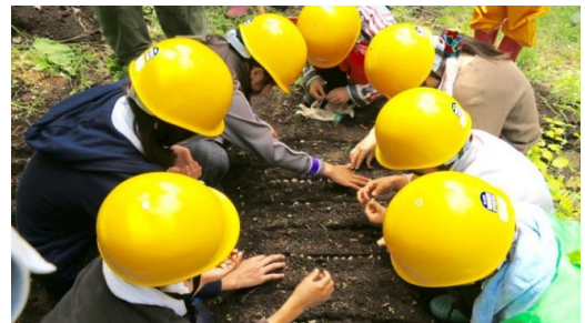
オシヨウニシとエリヤマザクラの種を蒔く