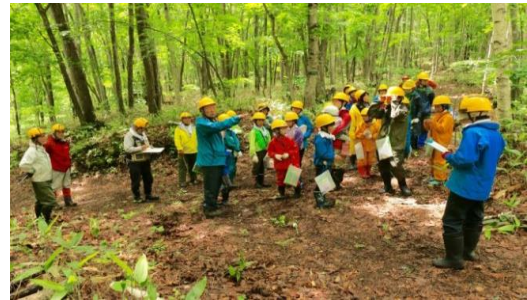
初夏の森を歩いて森の働きを学ぶ