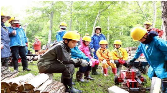
整理伐した丸太を薪割りの機で薪にする

薪づくり、初夏の森歩き、マイリーフ採り、森の虫を見る、種を蒔き、苗を植える、楢木の本伏せ、とたくさんの活動をしました。