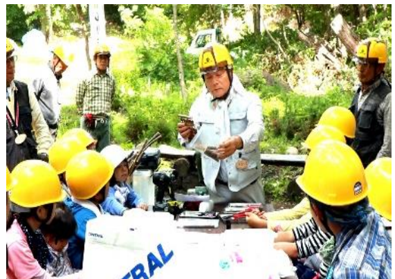
キットの組み立て方の説明を受け、親子共同作業でドングリそろばんを作る。