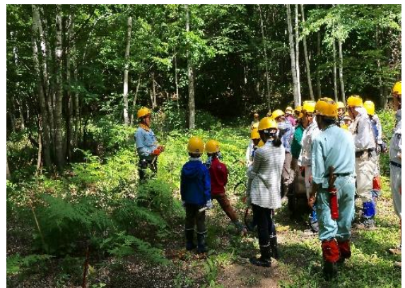
下草刈りを体験する。刈る前に下草刈りの目的、鎌の使い方を説明する。

夕食の前にまとめと感想を聞きました。隊員たちは下草刈りで草がスパッと切れて嬉しかった、本で